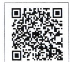
QR-Code เพื่อสอบถาม